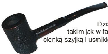
Cherrywood - Nazwa pochodzi od fajek wytwarzanych w gałęzi wiśni. Dziś nazwa ta dotyczy również pokerów z dnem takim jak w fajce Diuk. Takiego Cherrywooda ze szczególnie cienką szyjką i ustnikiem nazywa się też Tankardem, podobnie jak Diuka.