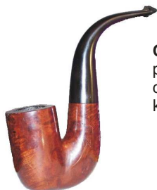
Oom Paul - Zwana Wujkiem Paulem. Ustnik wygięty pod kątem prawie 90 stopni przechodzi w szyjkę fajki ustawioną równoległe do główki. Fajka pojemna i idealna dla ludzi potrzebujących lulkę, którą mogą palić i nie trzymać jej w rękach. Dawniej fajka żeglarszy.