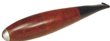
Zeppelin - Coś jakby cygaro z wrzośca.