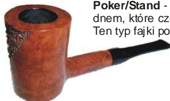
Poker/Stand - Główka fajki zazwyczaj w kształcie Billiard z płaskim dnem, które często przechodzi w płaską dolną część szyjki. Ten typ fajki powstał, by można było można ją było swobodnie odstawić na stół np. podczas gry w karty. Oczywiście główki miewają inne kształty: Dublin, Barrel (beczka), ustnik zazwyczaj saddle.